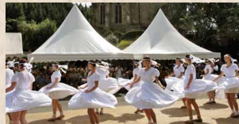
En 2010, la fête était animée par un groupe folklorique roumain.