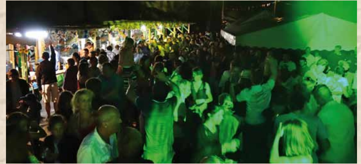
Cette année les deux bals populaires se sont déroulés en extérieur

Juste avant le feu d'artifice au dessus de la vallée du Ciboulet, près d'un millier de personnes ont envahi la place de la salle des fêtes pendant le concert du groupe Odlatsa qui avait remporté le tremplin des Poly'sons, à Montbrison, au début de l'année. Sur une scène improvisée en contrebas de l'église, les six musiciens ont offert un moment magique au clair de lune. En octobre, le groupe Odlatsa a reçu des félicitations du chanteur Renaud.