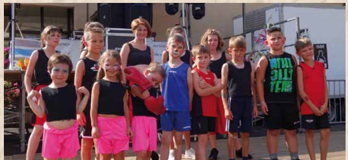
Chorégraphie des enfants sur Rocky