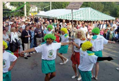
Les Ciboulettes ont animé plusieurs fêtes au village.

Journal Le Pays Forez Coeur de Loire - Jeudi 11 août 2016