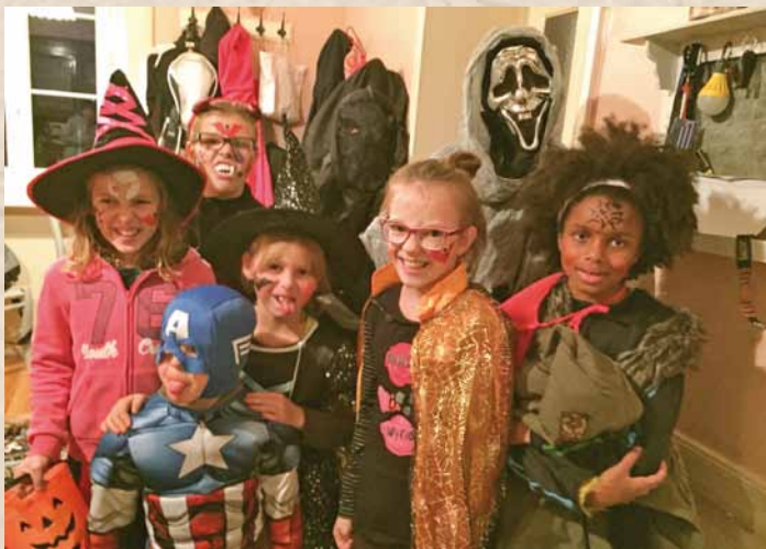
A Collet ▼