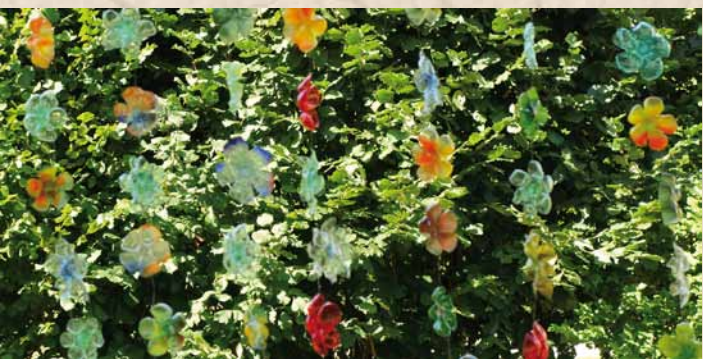
Pour la fête, St-Laurent-de-Chamousset a prêté de nombreuses décorations qui avaient été réalisées pour le rassemblement des St-Laurent-de-France.