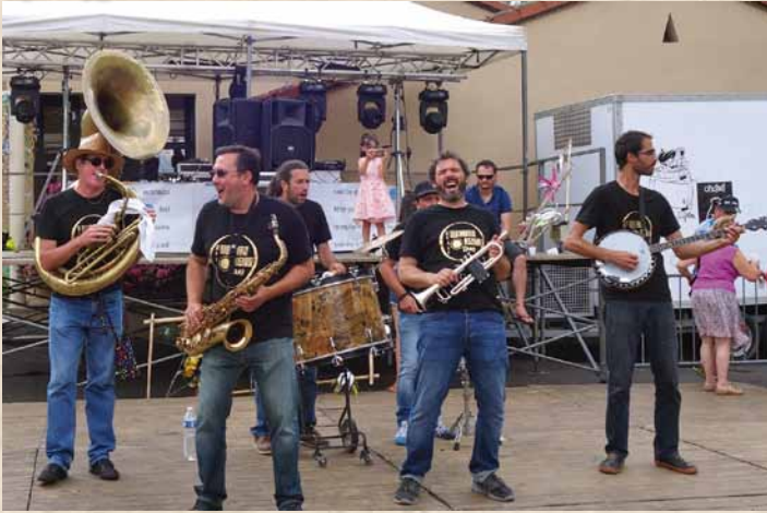
Fanfare Doctor Jazz Brass Band