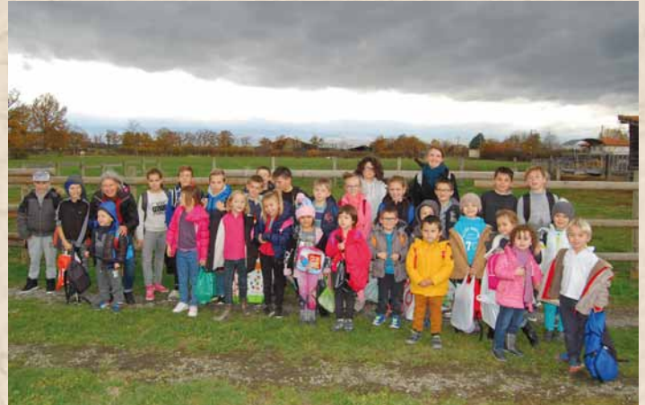
Les deux écoles en sortie scolaire