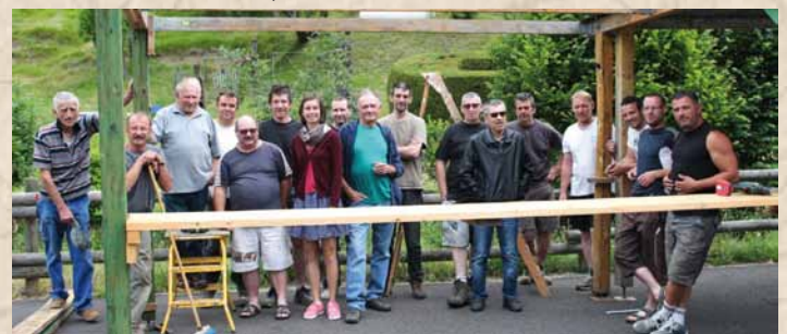
La grande buvette en bois, à la fois symbole et structure indispensable de la fête, a été montée samedi 2 juillet avec l'aide de la Société de Chasse.

Trois corvées de genêts les samedis 17 décembre, 28 janvier et 18 février aux Montagnes, à Chazelles et à Rochefort (en fonction de la météo). Rendez-vous à 13h30.