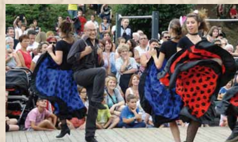
Depuis 4 ans, une troupe de 20 danseurs amateurs prépare des spectacles de haute qualité.