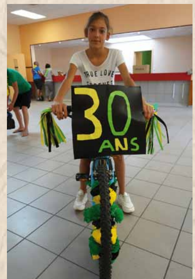
Défilé des vélos fleuris