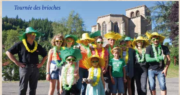
Tournée des brioches

Journal Le Pays - Forez Coeur de Loire - 18 août 2016