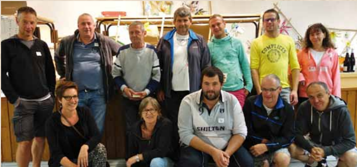
Vainqueurs du biathlon pétanque-belote.