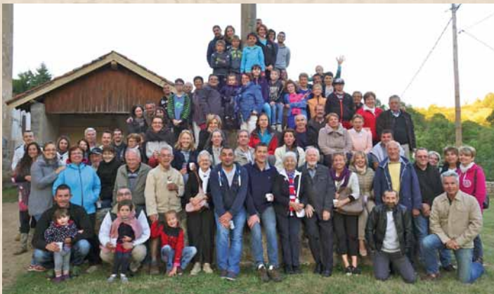
Barbecue géant du 13 juillet, en compagnie d'une dizaine de cousins québécois

Avec le Comité des Fêtes de Saint-Laurent-Rochefort, une belle année vient de s'écouler avec de nombreux temps forts : voyage du 02 avril, barbecue géant du 13 juillet, soirée bénévole du 29 octobre et bien sûr la grande fête au village. Le dimanche de la fête a attiré la foule et a clôturé en beauté ce trentième rendez-vous. Le comité des fêtes tient à remercier toutes les personnes qui ont participé, chacune à sa manière, à la réussite des animations. L'association espère que nous serons encore nombreux pour la nouvelle année qui s'annonce très animée.