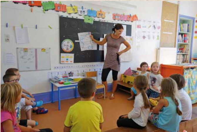
L'école aux Débats