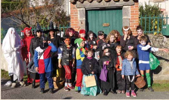
Au bourg ▲

Pour Halloween, fantômes et citrouilles ont envahi les différents hameaux pour célébrer les sorcières. C'est d'abord au hameau de Collet, samedi 29 octobre, que les enfants ont revêtu leurs plus beaux costumes de monstres en tout genre pour effrayer leurs voisins et récolter quelques bonbons. Puis lundi 31 octobre, c'était au tour des enfants de Rochefort, d'Anzon, du Bourg et Chazelles de se prendre pour des sorcières.