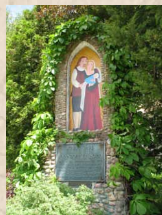
Ste Anne de Beaupré Monument commémoratif