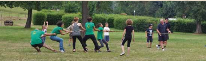
Le comité des fêtes a vaillamment participé aux jeux intervillages de la fête à Saint-Thurin, dimanche 24 juillet. L'équipe est arrivée deuxième.