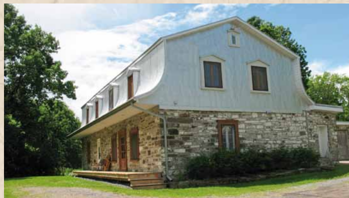
Ste Anne de Beaupré Maison rénoverée sise sur les fondations d'origine

Article tiré du journal « Le Pays - Forez Coeur de Loire, du 08.10.2015 »