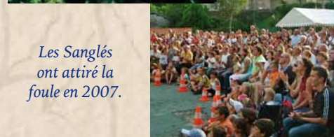
Les Sanglés ont attiré la foule en 2007.